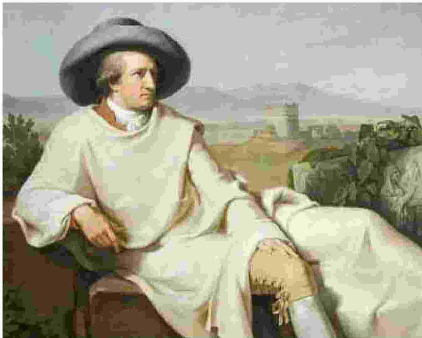
Tischbein, Goethe nella campagna romana. Sotto, DeLillo, Hemingway, Silone. In basso, l'autrice

Si può percorrere la Liguria in versi, sulle tracce di poeti e