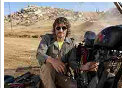
5 motivi per cui Vincent Gallo è un'icona