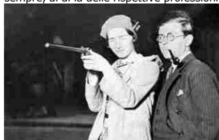
SIMONE DE BEAUVOIR E JEAN PAUL SARTRE