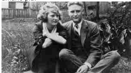
F. SCOTT E ZELDA FITZGERALD