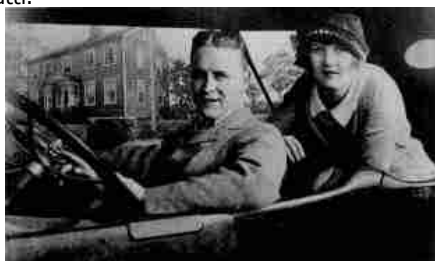
F. SCOTT E ZELDA FITZGERALD